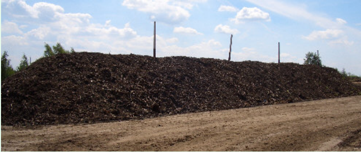
Klärschlamm gepresst oder ungepresst + Strukturmaterial Waste water sludge pressed or non pressed + structure material