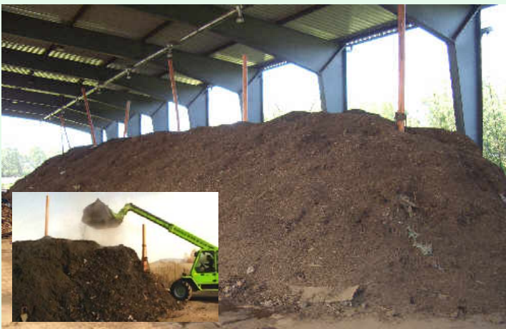
Bioabfall + Strukturmaterial / Biowaste + structure material