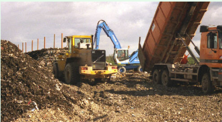
Hausmüllfraktionen / Municipal solid waste